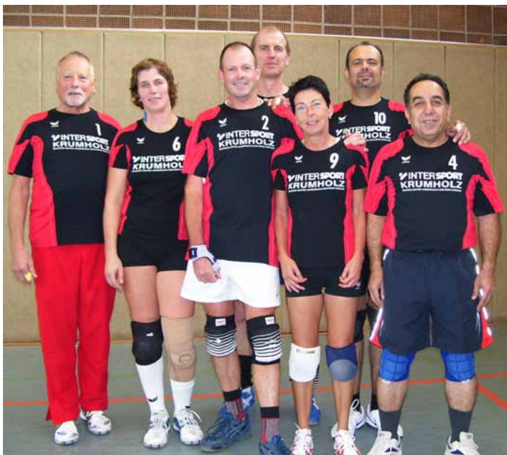
Die VCN77- Senioren(innen) I (Senioren-Liga B)