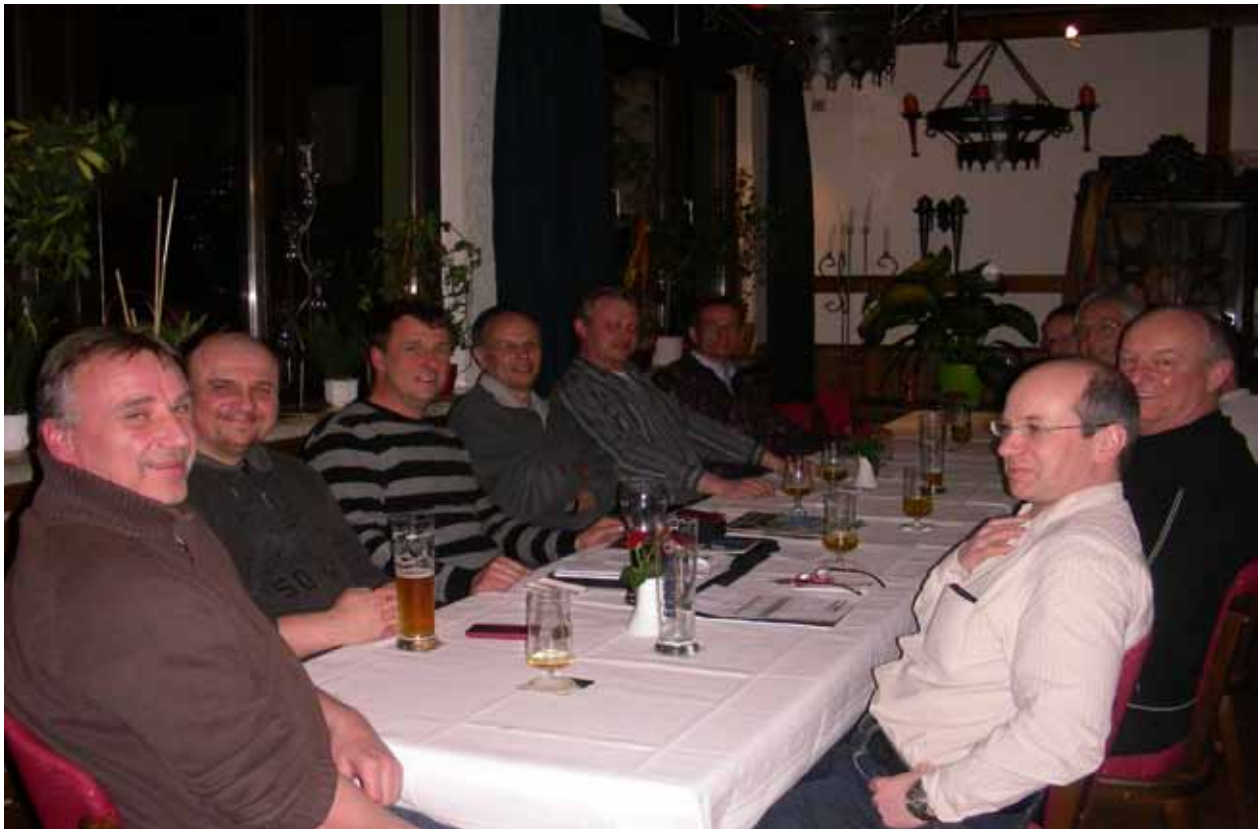
Der Mannschaftsrat tagt