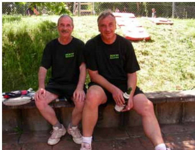
Wir haben Fertig